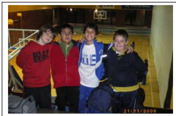
Jornada de Dinamitzadors. Banyoles