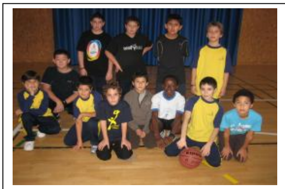
Partit de bàsquet al pavelló de Salt

http://blocs.xtec.cat/efbruguera/pla-catala-esport/