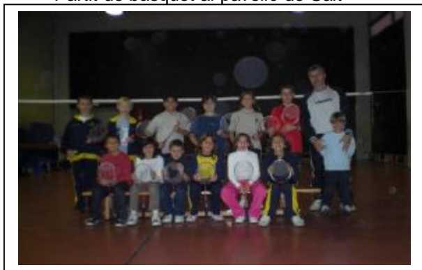
Jornada de Badminton