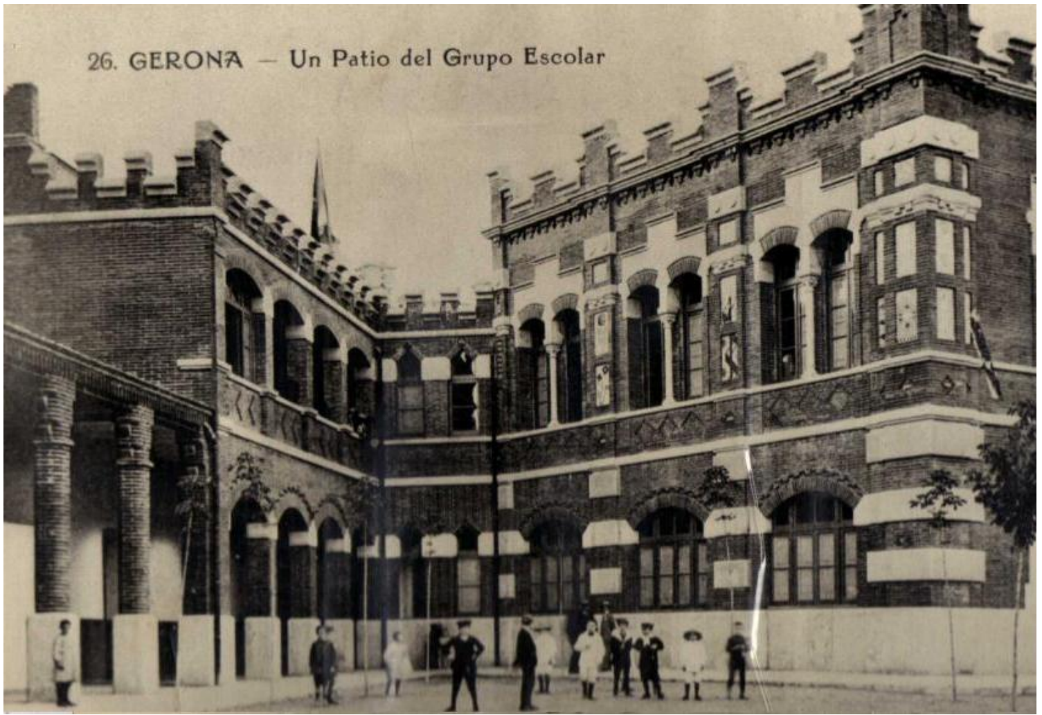
26. GERONA — Un Patio del Grupo Escolar

Revista de l'Escola Joan Bruguera - Girona