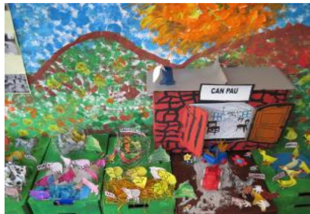
Fotografia de l'activitat i maqueta de la granja de "Can Pau" realitzada per els nens/es de p-3.