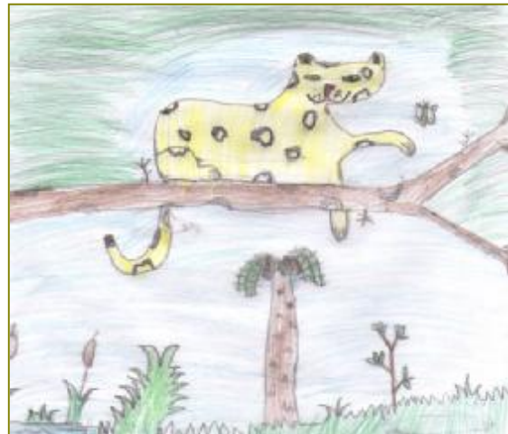
Autor: Andreu Canaleta